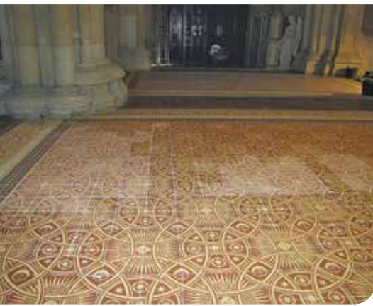
Auch im Chorraum sind schon einige Flächen fertig gestellt (oben: vor der Restaurierung, unten: danach).